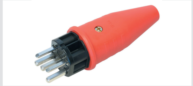
Stecker Typ 15/25 230/400V 3LN