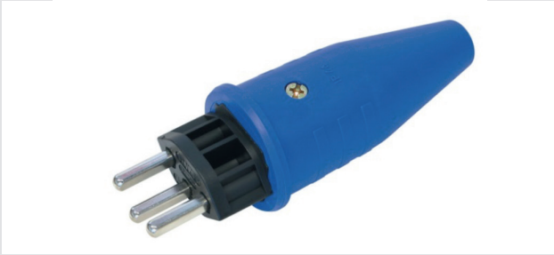
Stecker Typ 12/23 230V LN